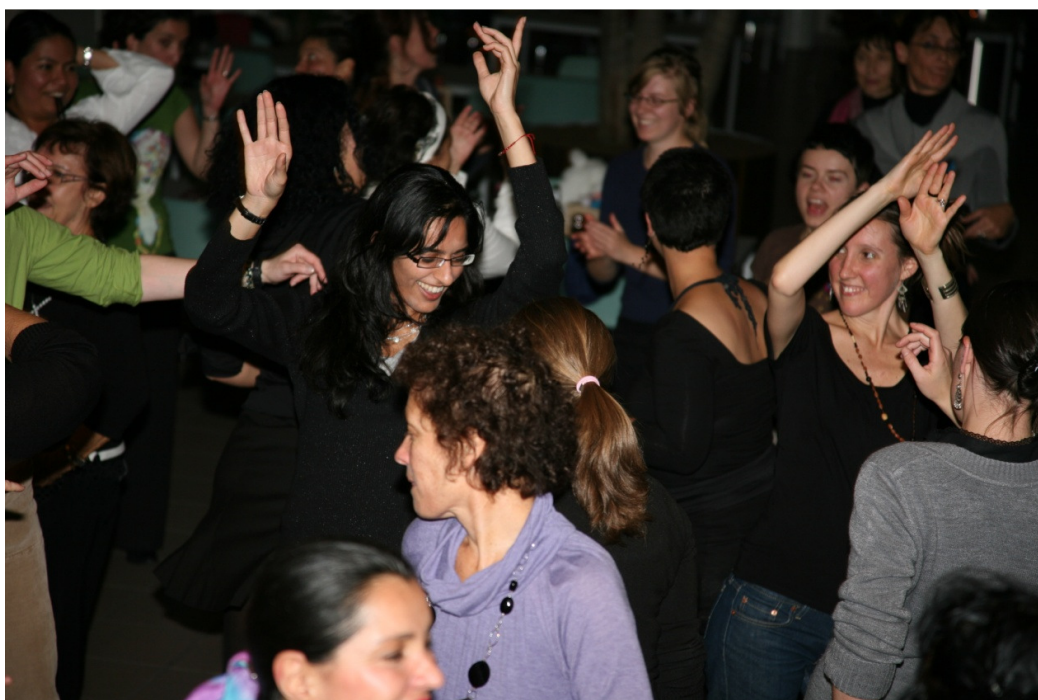
Foto: Deelnemers vieren de afsluiting van een succesvolle conferentie