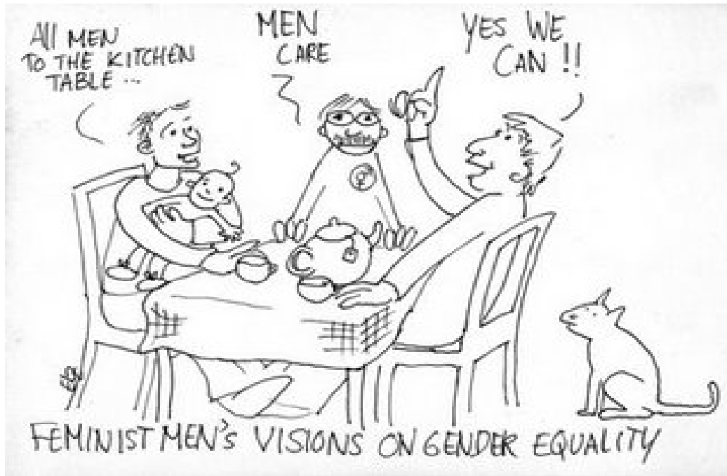
Illustratie: Els Rijke

Door Steven Schoofs, namens de Keukentafel