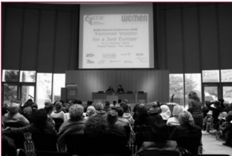
Foto: WIDE Annual Conference 2008, The Hague

WO=MEN trad in 2007 toe als nieuw nationaal platformlid van Women In Development Europe (WIDE), een Europees netwerk van gender platforms en experts. Om de nieuwe samenwerking te consolideren, werd WO=MEN het daaropvolgende jaar geselecteerd als gastorganisatie van de jaarlijkse internationale WIDE Conferentie. De conferentie, getiteld 'Feminist Visions for a Just Europe', vond in oktober 2008 plaats in het historische Vredespaleis in Den Haag. Tijdens de driedaagse conferentie bespraken de 200 internationale deelnemers de verantwoordelijkheid van Europa ten opzichte van gendergelijkheid en de rechten van vrouwen wereldwijd. De gecombineerde feministische visies van deelnemers vanuit vier windrichtingen vormden het uitgangspunt voor debatten en lezingen. Centraal stonden onze gezamenlijke kansen en uitdagingen van een geglobaliseerde wereld, waarin de feminisering van arbeid, migratie en armoede een onontkoombaar feit zijn geworden.