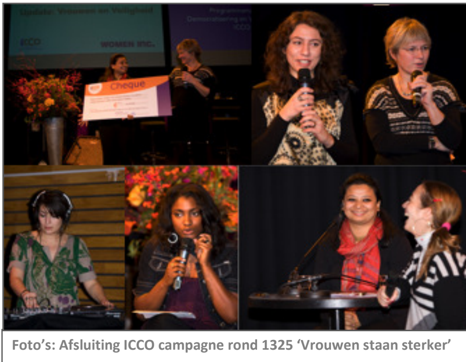
Foto's: Afsluiting ICCO campagne rond 1325 'Vrouwen staan sterker'

Alvorens de eigen prioriteiten nader te kunnen bepalen heeft de werkgroep nadrukkelijk de wens uitgesproken om eerst meer zicht te krijgen op wat andere partners in het plan al doen. Zodoende kan de werkgroep aanvullend en strategisch werken en op deelgebieden een voortrekkersrol spelen. Dat heeft geleid tot het rapport '1 jaar NAP 1325' (zie onder).