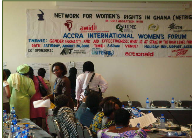
FOTO: Women's Forum on Gender Equality and Aid Effectiveness