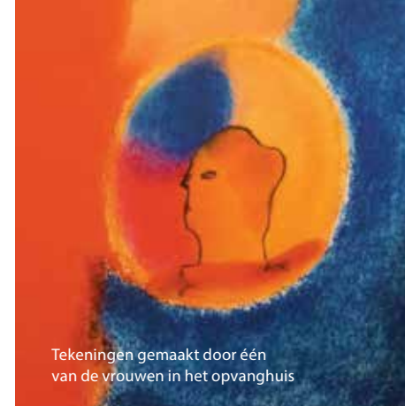
Tekeningen gemaakt door één van de vrouwen in het opvanghuis

Links: Het werken met kinderen levert dit bijzondere schilderij op