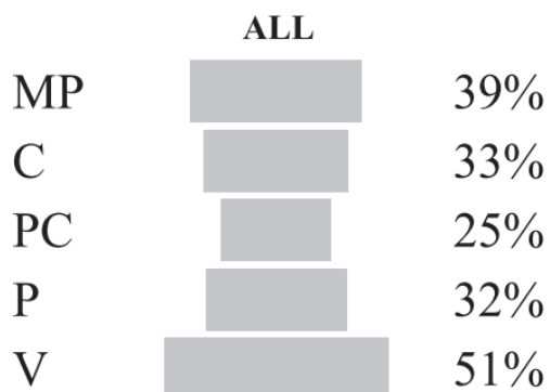
Figure 1. Women's representation across different levels on the ladder of recruitment (the length of each bar equals the percentage of women in the group) in Denmark 2012.

Onderzoekers in Denemarken stelden tegenover het piramidemodel een zandlopermodel voor (Kjaer & Kosiara-Pedersen, 2019). Zij laten zien dat het knelpunt voor vrouwen in de politiek vooral zit in de fase van aspiranten. Namelijk: in de bevolking is de verdeling mannen en vrouwen evenredig, maar vervolgens zijn er onder partijleden minder vrouwen – en daarmee minder potentiële kandidaten. Er zijn daarentegen weer relatief veel genomineerde vrouwen ('kandidaten') gegeven de verdeling binnen de partij en dus hebben vrouwen relatief meer kans dan mannen om verkozen te worden. Uit Kjaer & Kosiara-Pedersen, 2019: